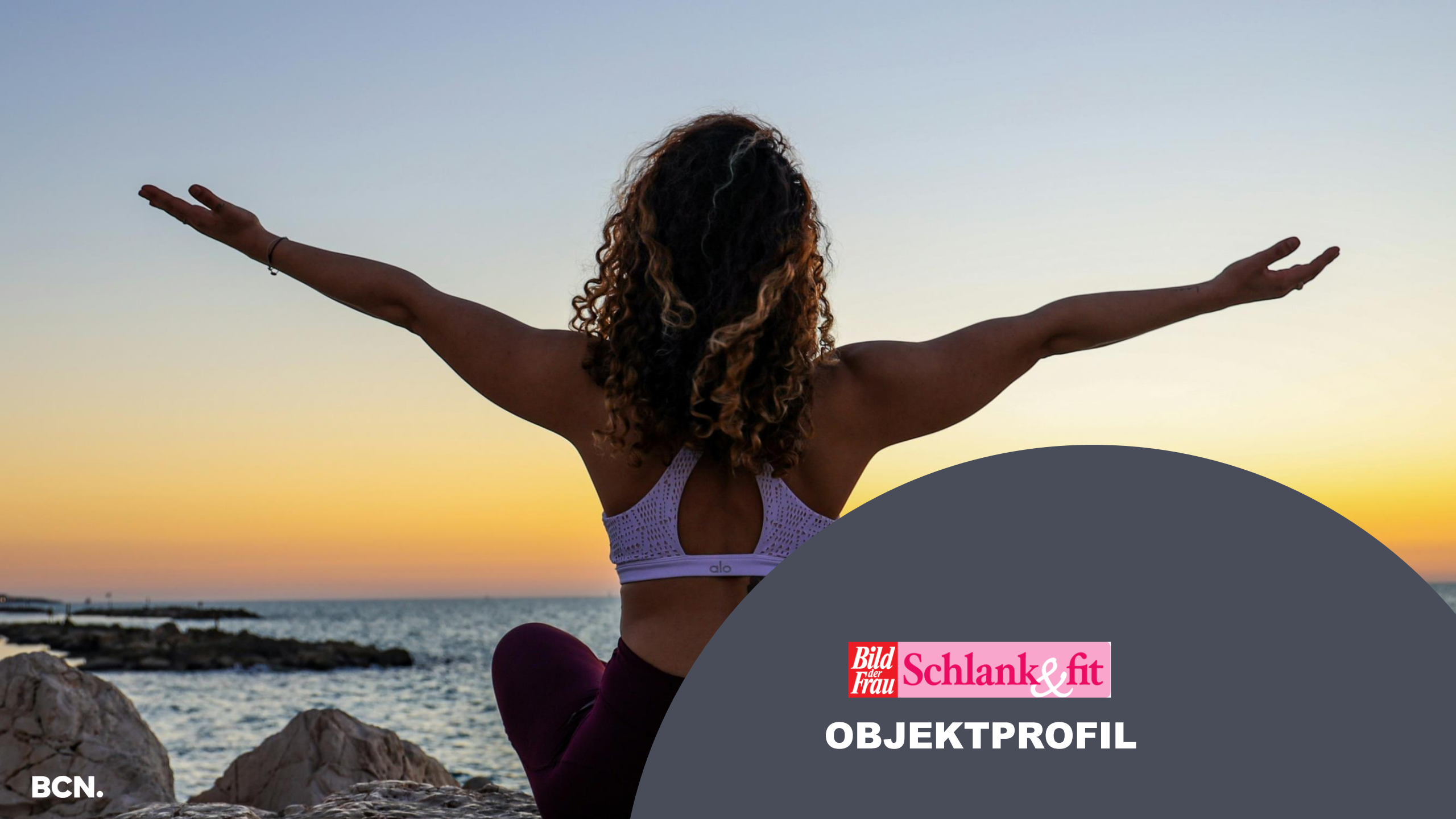
Bild der Frau Schlank & fit