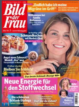
BILD der FRAU wöchentlich