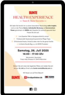
Standalone NL (BUNTE)