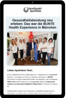
B2B NL (Zukunftspakt)